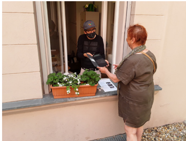
Übergabe des Digitalen Care-Pakets unter Einhaltung der Hygienerichtlinien

Das digitale Versorgungspaket beinhaltet dabei sowohl die technische Ausstattung für den Zugang in Form von Tablet PCs und Senioren-Smartphones mit mobiler Internetverbindung als auch vielfältige Materialien und Angebote zur Begleitung und Unterstützung der Senior*innen auf ihren ersten Schritten in die digitale Welt. Die Geräte werden über einen Zeitraum von acht Wochen verliehen. Sie sind an die Bedürfnisse älterer Einsteiger*innen angepasst und verfügen über ein mobiles Datenvolumen von O2, das auch die Nutzung datenintensiver Anwendungen über einen längeren Zeitraum ermöglicht. Damit können Senior*innen auch in Zeiten der räumlichen Trennung den Kontakt mit Bekannten und Familie über Videotelefonie aufrechterhalten, wichtige Informationen gerade auch über aktuelle gesundheitliche Themen erhalten oder internetbasierte Medienangebote der klassischen TV-Sender und anderer Streamingdienste nutzen.