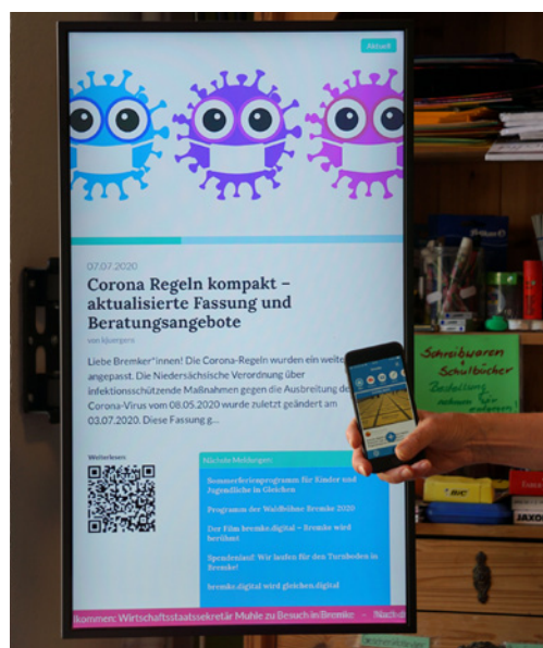
Der digitale Schaukasten

So können Nutzer*innen die Informationen aus und vom Dorf und der Gemeinde nicht nur auf der Webseite (DorfPage) einsehen, sondern mit dem DorfFunk direkt auf ihr Smartphone bekommen: Zum Beispiel Hinweise auf Baustellen und Umleitungen, aktuelle Termine und Neuigkeiten aus dem Dorf oder, im Jahr 2020 besonders relevant, tagesaktuell die jeweiligen Richtlinien