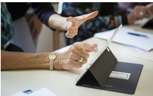
Senior*innen erhalten Unterstützung bei den ersten Schritten in die digitale Welt.